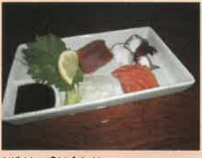
お造り 盛り合わせ

一見入りづらいかな？という雰囲気もありますが、入り口のドアを開けると温かく和やかな空気が伝わってきます。