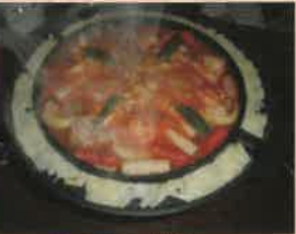
チースタッカルビ 要予約 1人前 ¥1200 1日3組限定 (2人前より予約承ります)

個室も2人から20人くらい入る大部屋があるので大勢でワイワイやるのもよし、お一人でゆつくり料理とお酒を楽しむのもよし、気軽な気持ちで一度覗かれてみてはいかがですか？