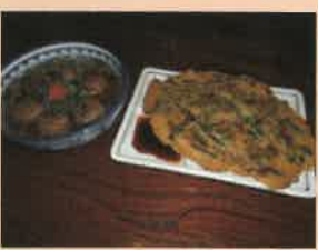
揚げだしたこ焼き (左) チジミ (右)

今までの常連のお客さんも大事にしたいということであり多くは宣伝されて来なかったそうですが、今回は少々無理を言ってお取材させていただきました。