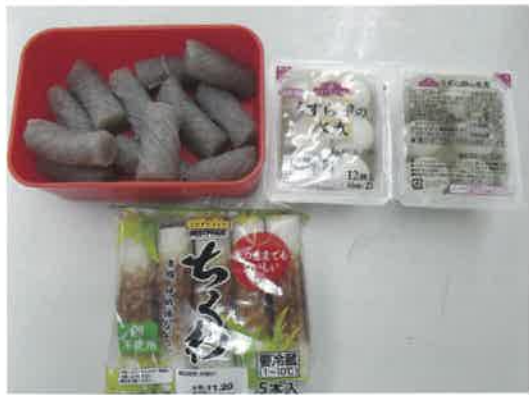
おでん部門 (どれも無謀でした...)

お菓子部門の中のベビースタードデカ&カール(うすしお)は、食べ出すと止められなくなる美味しさ。絶対合うだろうと予想していた、じゃがりこが意外と絡み合わず、ナシと