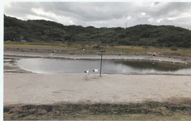
ひょうたん池コウノトリ夢公園 (高砂市北浜町西浜) 高砂市内の池にコウノトリが飛来したことがあり、ひょうたん池にも来るのを願って愛称が付いた。

皆さん、いかがでしたか？日々目にしてきたものでも、いわれを知らば見方が変わってくるかもしれませんね。是非、はぴはり片手に、実際の場所へ足を運んでみてください♪