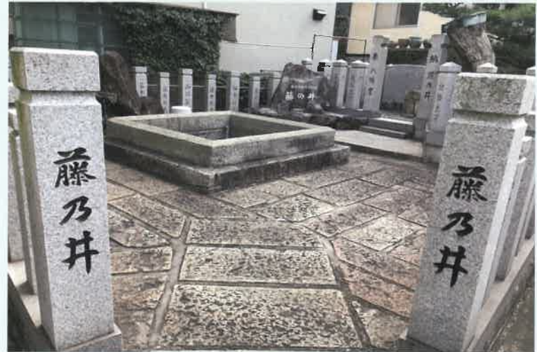
藤乃井 (高砂市北浜町西浜) 八幡大神が開いたという伝説のある井戸で、「命の水」として大切にされてきた。高砂市指定文化財に認可されている。