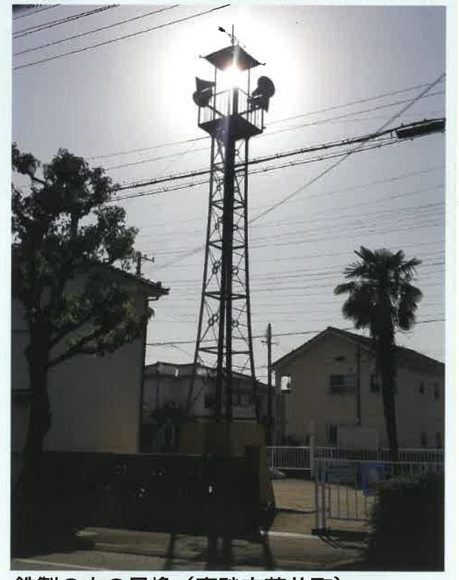
鉄製の火の見櫓 (高砂市荒井町) 火の見櫓をお目にかかれる場所は今では少ない。現在は防災無線スピーカーがついている。

◎前号で募集したあるあるハコを 各ページの柱に載せていきますので、この小さなスペースにもご注目★応募してくださいました方、ありがとうございました！