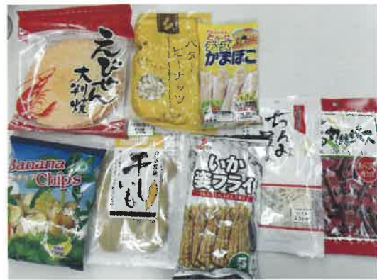
おつまみ部門 (意外なものがマッチ♪)