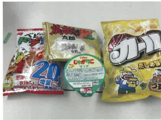
お菓子部門 (塩味がアクセントになりそう)