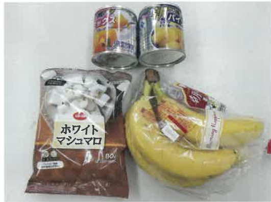
定番部門 (当然おいしいものばかり♪)