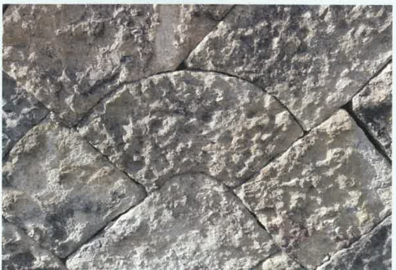
荒井神社 (高砂市荒井町千鳥) 荒井神社の玉垣の下の石垣の中に、よく見ていくと、扇形の石を発見できる。

今回ご紹介した場所以外に、皆さんの周りで「ちょっと気になるけどほかの人に聞くのは...」「調査してほしいけどどこに尋ねれば...」など、ふとした疑問があれば、どこでも駆けつけます！ご依頼お待ちしております。