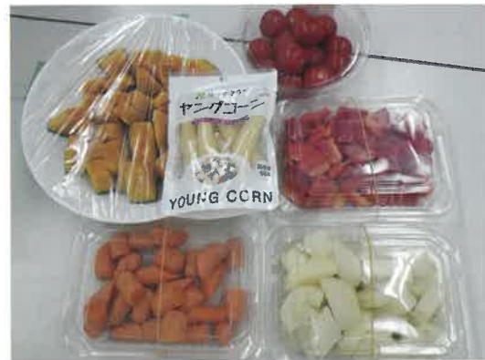
野菜部門 (意外といけるかも！)